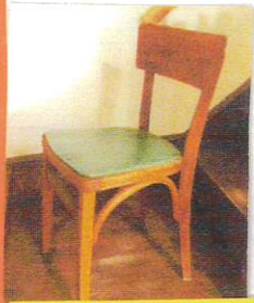
タツシが生まれる前からあります!

西島眼鏡店も、この狭い空間に、いろいろな椅子があるんですよ!「ニジマの椅子展」ではありませんが、ニジマにいらした時は是非「椅子」にも注目して下さい!