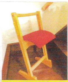
100周年記念チェア by たなかじまゆ