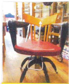
イタリアのセンス