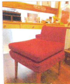
50年以上ニジマにいます! 父家具の職人さん作♡