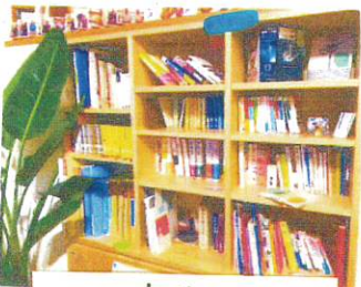
N文庫でもセレンディピティあるかも!