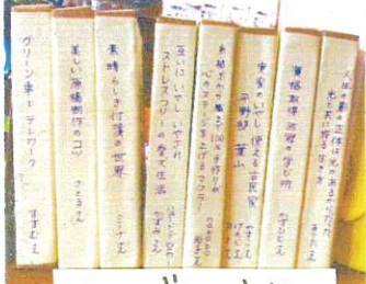
丸テーブルの上に皆さんの「伝える・・・」