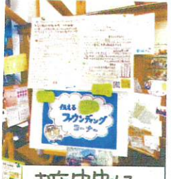
お店中央に特設コーナー