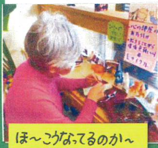
ほ～こがなってるのか～

我家の二人の娘達は、片付けが大好きだったり、買物にエコ意識が強かったりします(例えば「海水を汚染しない日焼け止め」を選ぶ)。そこに、使わなくなったメガネを分別的に捨てにくいとお客さまの声が重なり、部屋の片付けのようにす、まりとした気分になるリサイクル活動をしようと思い立ちました。探してみると、金属製メガネを受け入れているリサイクル会社がありました。溶解して再利用しやすい金属を抽出して仕かします。お～これは渡りに舟と思いつく手元のメガネを見ると、金属と樹脂部品が混在していました。この分別を、メガネ族立ちの儀式としてお客さま自身にして頂こう!すると、これが大好評! あ～さっぱりした!と晴れやかに言う方。お家から16本のメガネを持参し、2時間かけて分別を完遂する方など。大きなす、まり感がそこで生み出されたのでした。そのうちに、自分のメガネが形を変えて手の中にあるかも。あなたもニジマでメガネを分別してす、まり処分しましょう!