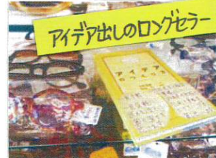
アイデア出しのロングセラー