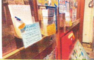
手前が一言カードとペンです。

ニジジマには、休業日にいらした方にもメッセージを残して頂けるよう「一言カード」と「ペン」「ポスト」が閉店時の店頭にて用意してあります。ある休日明けの朝、ポストを見ると、一言カードが投函されていました。それにはこうありました。